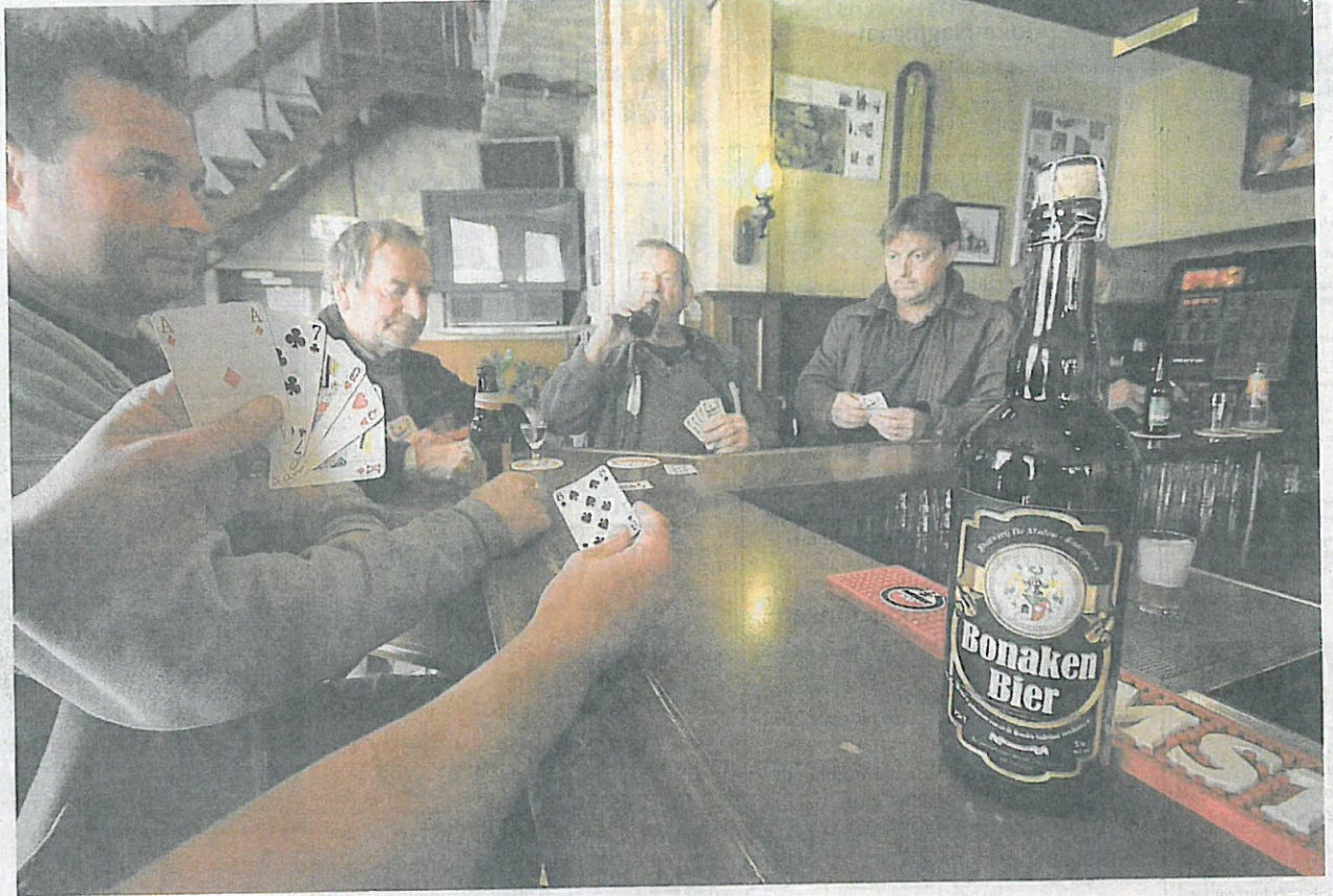
Bonakers in hun stamkroeg Keijzer in Leimuiden.