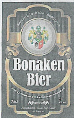
Het etiket van het Bonaken Bier.

de bevolking: bonaken is een oud kaartspel dat alleen in de kroeg wordt gespeeld. Met veel bier erbij dus. Het gaat er niet om wie er wint, maar om wie er verliest. Zoals het een serieuze kroegsport betaamt, zijn de spelregels onnavolgbaar.