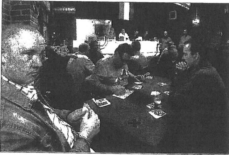
Kaarten en roken zijn onlosmakelijk met elkaar verbonden. Maar tegelijk gaat niet meer.